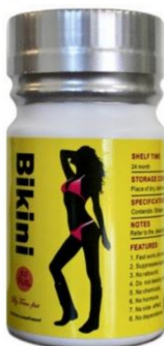
Fig.1: Imagen del producto BIKINI cápsulas