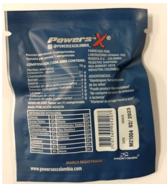
Fig.1: Imagen del producto Powers-X comprimidos